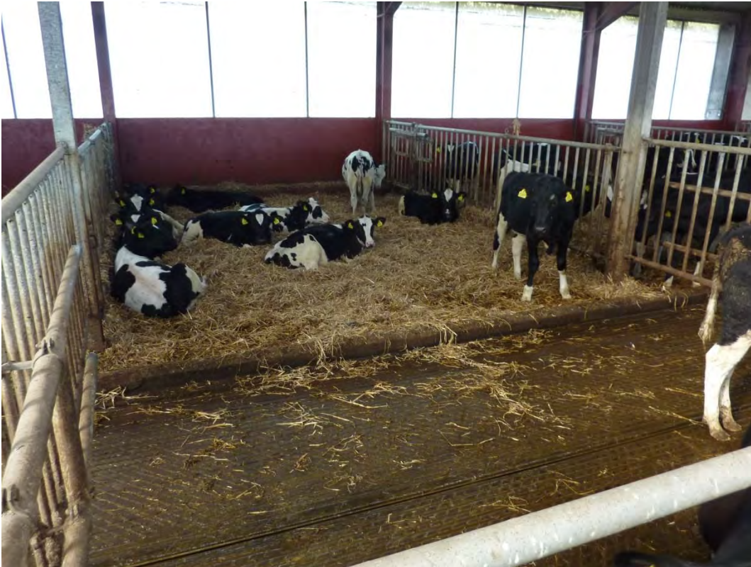
Fra 7 måneder og indtil 1 måned før kælvning er kvierne opstalde i sengebåsestald med sand i sengene og rillede spaltegulve